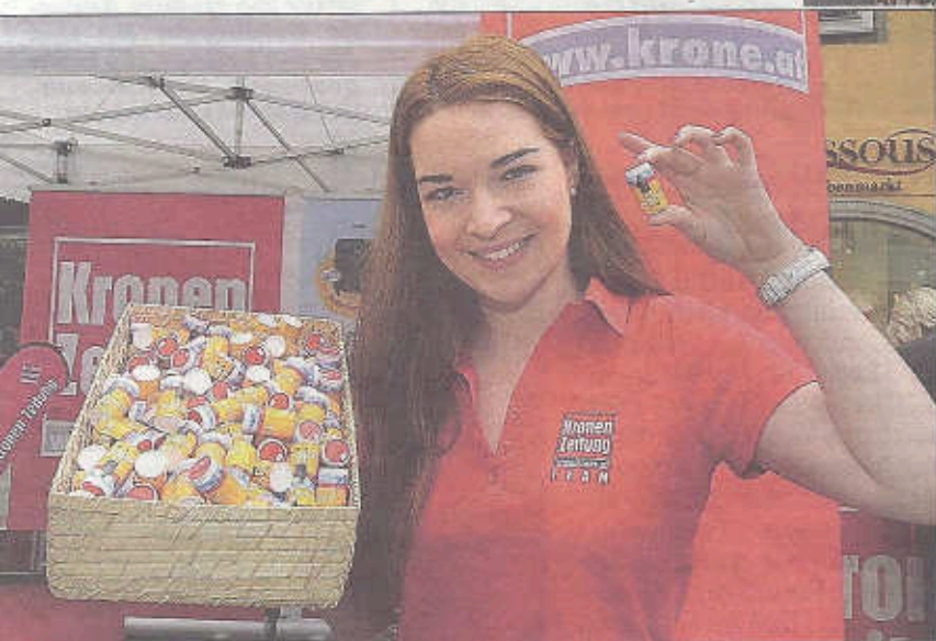
◀ Kleine Salzstreuer als Geschenk sowie ein tolles Gewinnspiel mit vielen Reisen ins Salzkammergut warten beim „Krone“-Stand am Taubenmarkt.