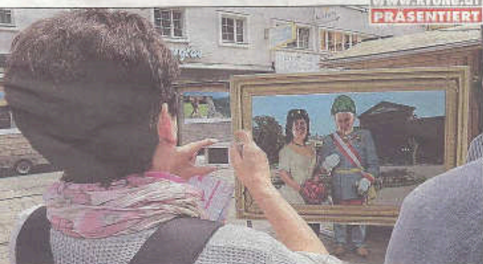
Italienische Gäste nutzen die kaiserliche Fotowand