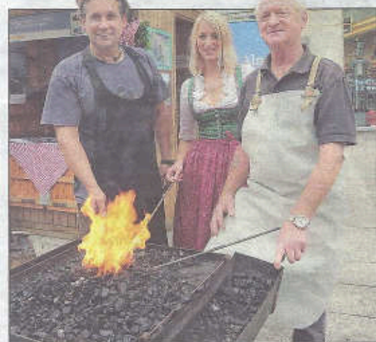
Feurig: Wimsbacher Hammerschmiede